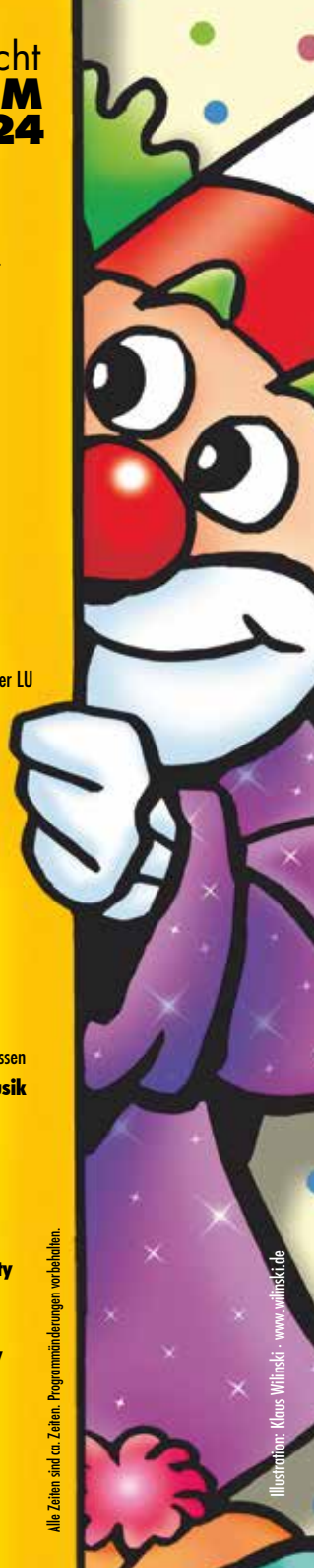
Alle Zeiten sind ca. Zeiten. Programmänderungen vorbehalten.