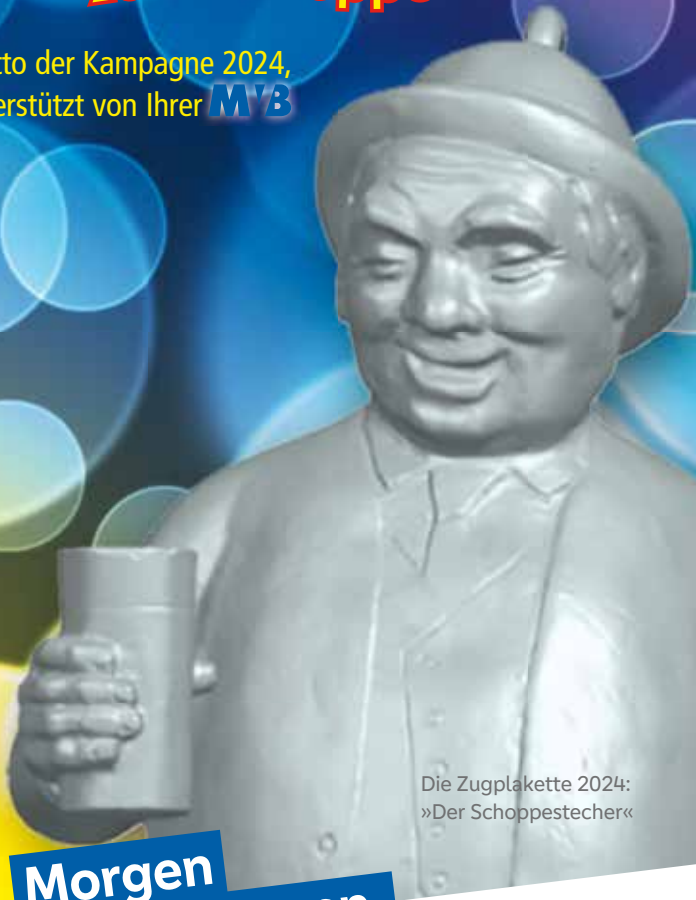
Die Zugplakette 2024: »Der Schoppestecher«

Motto der Kampagne 2024, unterstützt von Ihrer MYB