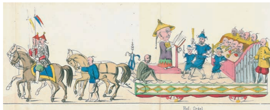
... im Leporello aus dem Jahre 1859.

die Chinesen nicht auch nach Mainz kommen? So besuchten Prinz „Dschin-Tschong-Schui-Heerd-Hoang-Ti“ und Prinzessin „Schul-Mayer-Hoang-ta“, hinter denen zwei waschechte Mainzer steckten, das Mainzer Prinzenpaar. Zum Schluss